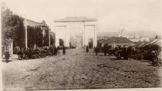
Въездъ въ г. Курскъ съ западной стороны и Херсонскія ворота.