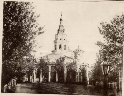
Церковь св. Троицы въ Курскоѣ девичьѣ монастырѣ