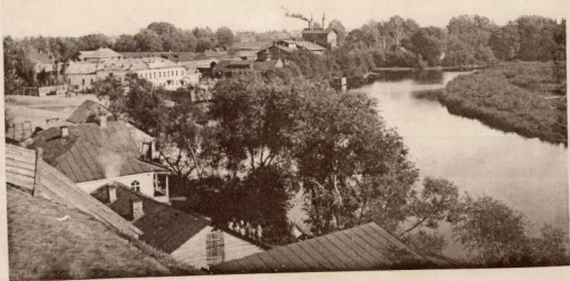
Берега р. Тускори съ сѣверо-восточной стороны г. Курша.