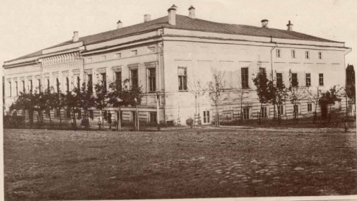
Губернаторскій домъ въ г. Курекъ.