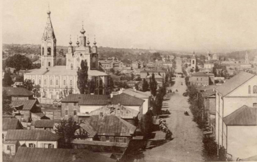
Древнейшая часть г. Курека, Спасская церковь и улицы Золотаревская и Архангельская.