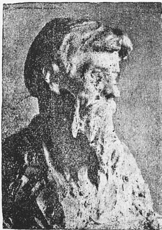
Бюст отца художника— раб. И. А. Шуклина.

Мне было 10 лет, когда родился брат Иван Адрианович. Это было в 1879 году. Ребенок он был необыкновенно хилый. Я хорошо помню, мать часто говорила: „он жив не будет.